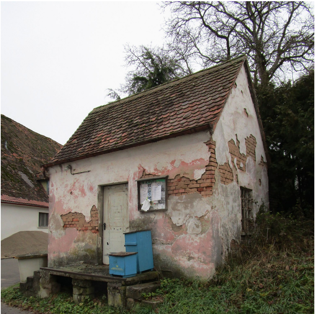
Eines der letzten stattlichen Bauernhäuser in Flexdorf