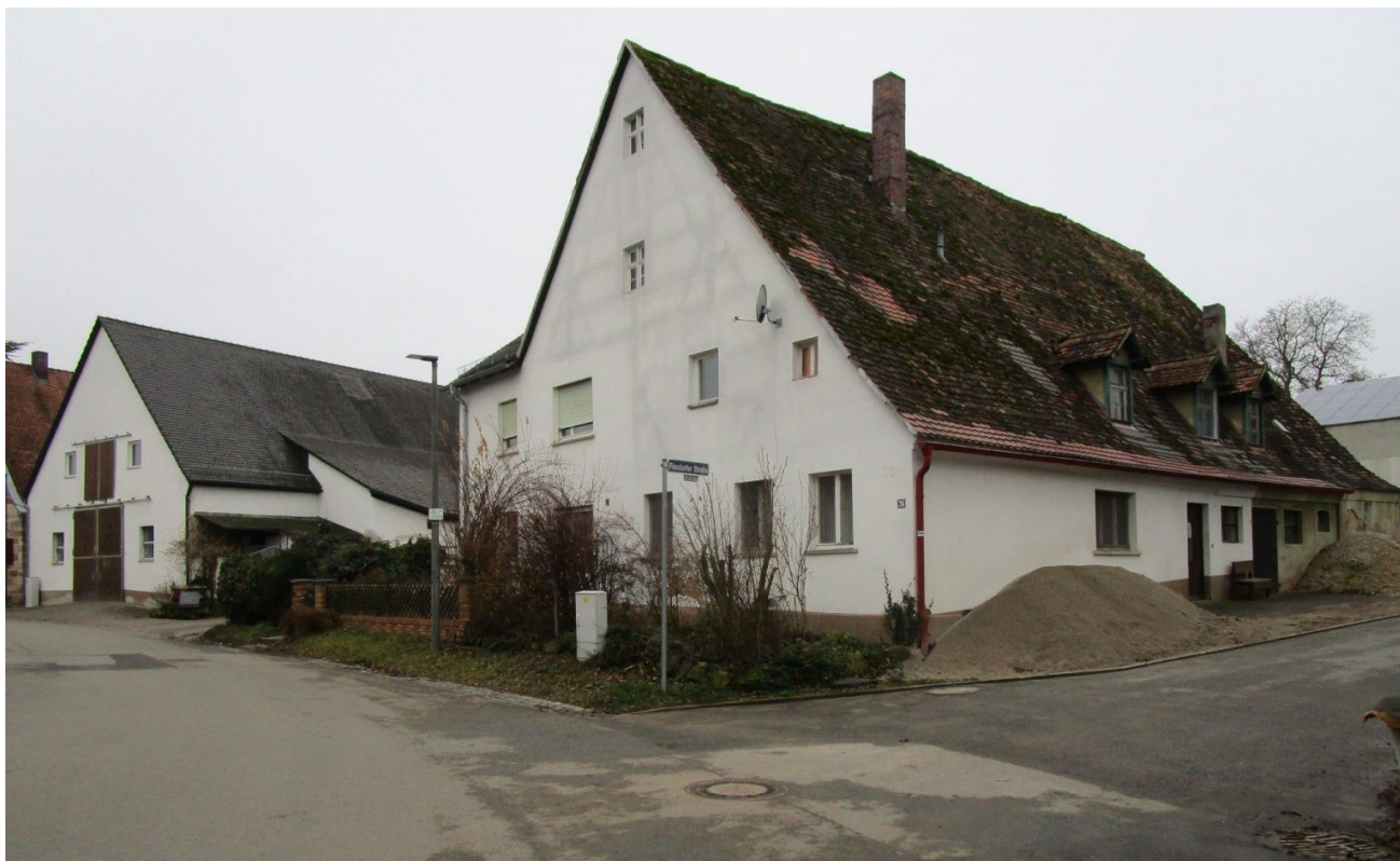
Die Scheune und das ehemalige Wohn-Stall-Haus Vacher Straße 3/Hochstraße 2.